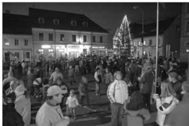
Hvězda stromu - Horní náměstí 3. 12. 2006