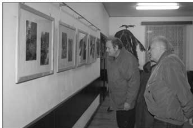
Výstava fotografií Postřehy potrvá na MěÚ do konce prosince