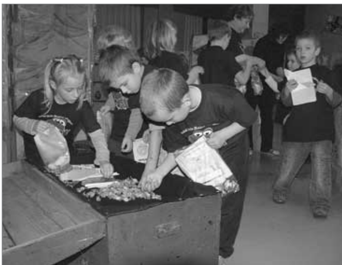
V dalších dnech navštívili školu u pošty ještě předškoláci z MŠ Oldřichovská a MŠ Liberecká