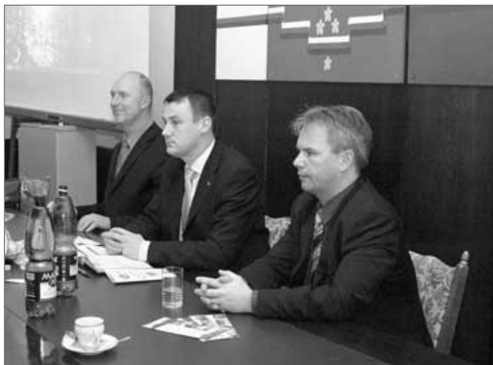
Dne 16. května proběhne v Hrádku nad Nisou sbírka Český den proti rakovině, známější pod názvem Květinový den.

V Hrádku nad Nisou zasedala 5. 4. rada Sdružení obcí Libereckého kraje. Za účasti hejtmána Libereckého kraje Petra Skokana byla projednávána problematika nového stavebního zákona.