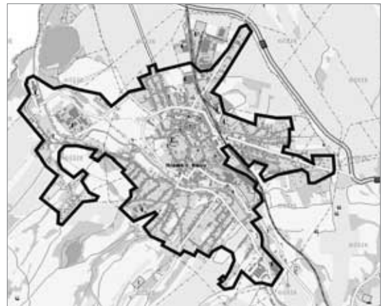
Mapka aglomerace Hrádek nad Nisou s vyznačením hranice, kde je potřeba do roku 2010 provést odkanalizování.