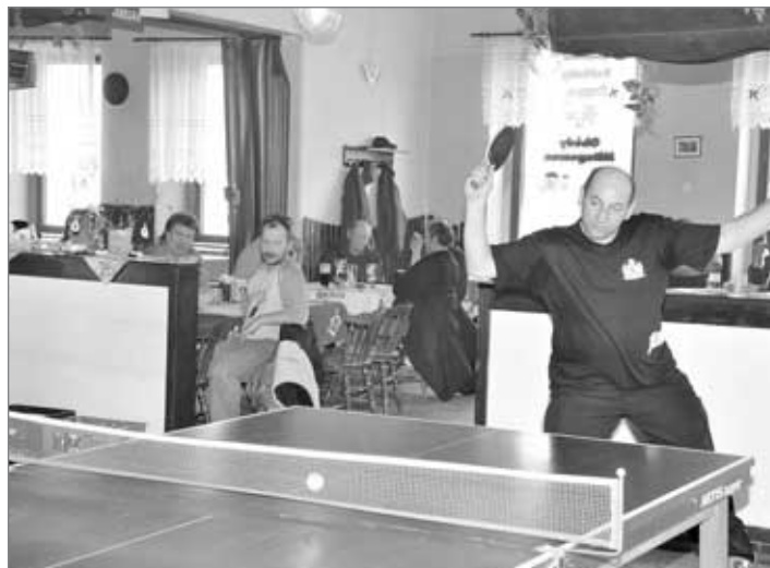
„Příznivci“ Dělnického domu začali pořádat turnaje pro radost. Po šipkách následoval turnaj ve stolním tenise a další turnaje se chystají. Ceny pro turnaj ve stolním tenise sponzoroval pivovar Konrád.

V další fázi oprav má na řadu přijít restaurace a jídelna, v teplých dnech bude otevřena také terasa.