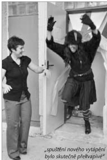
„spuštění nového vytápění bylo skutečně překvapivé“

Nejen pečivem pro Hrádek a mnohá místa Libereckého kraje je užitečná pekárna pana Endlera. Při pečení je pochopitelně potřeba velké množství tepla, které nelze přímo v pekárně beze zbytku využít. Těsné sousedství pekárny a mateřské školy Liberecká přímo vybízelo k využití zbytkového tepla k vytápění školky.