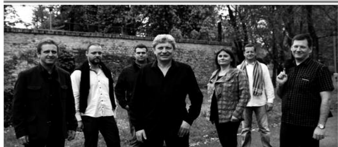
Kostel sv. Bartoloměje 24. května od 19.00