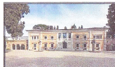
→ Vila Massima